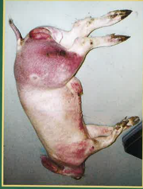
Krvavi profjev i crvenilo na koži vrata, grudni i nogu