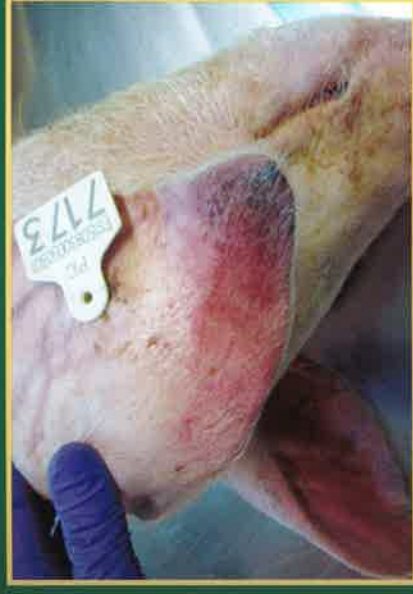
Cijanozna – plavo ljubičasta boja na vrhovima uški

ASK se manifestira različitim kliničkim znakovima. Zaražene, bolesne svinje uglavnom ugibaju. Obično se javlja gubitak apetita, ležanje i nevoljkost, a svinje brzo i iznenada uginu. Rijetko se pojavljuju drugi klinički znakovi: potištenost, gubitak tjelesne težine, krvarenja na koži (vrhovi uški, rep, noge, grudna i trbušna regija), otežano kretanje i pobačaji krmača. Klinički znakovi se teže uočavaju u divljih svinja.