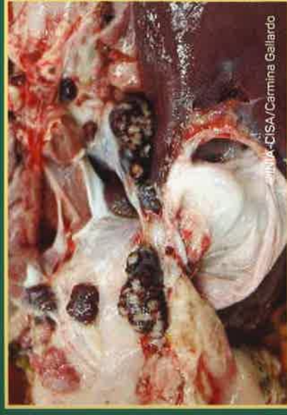
Krvavi limfni čvorovi