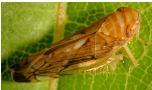
Slika4. američki cvrčak ( Scaphoideus titanus )

Praćenje populacije američkog cvrčka vrši se postavljanjem žutih ljepljivih ploča, koje se vješaju početkom srpnja na srednju armaturnu žicu, a zamjenjuju se svaka dva do tri tjedna.