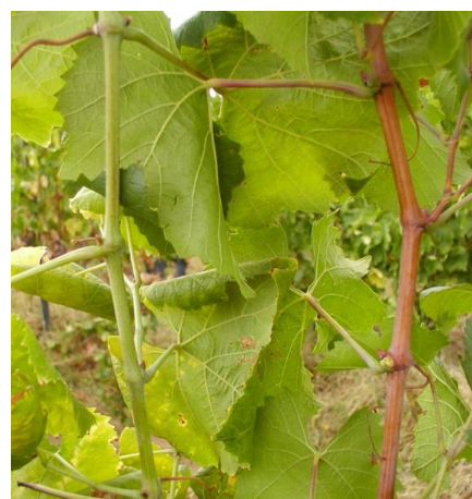
Slika1 i Slika 2: Simptomi na lišću